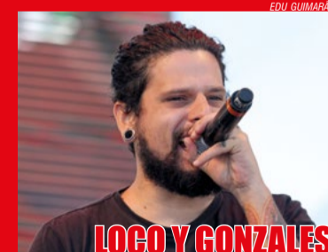
LOGO Y GONZALES