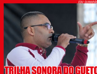
TRILHA SONORA DO GUETO