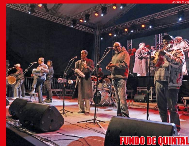
FUNDO DE QUINTAL